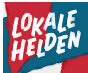
P 15 LOKALE HELDEN ZATERDAG 30 APRIL