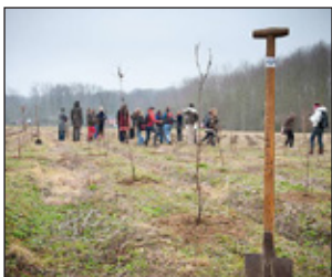
P 7 EEN BOOST VOOR BOS