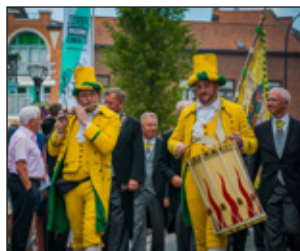
P 11 DE FIERTEL ZONDAG 12 JUNI