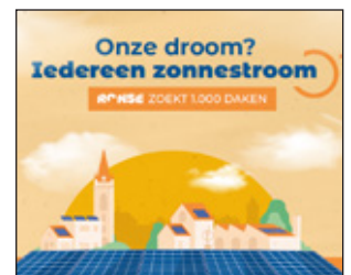
P 19 LOKAAL ENERGIE- EN KLIMAATPACT