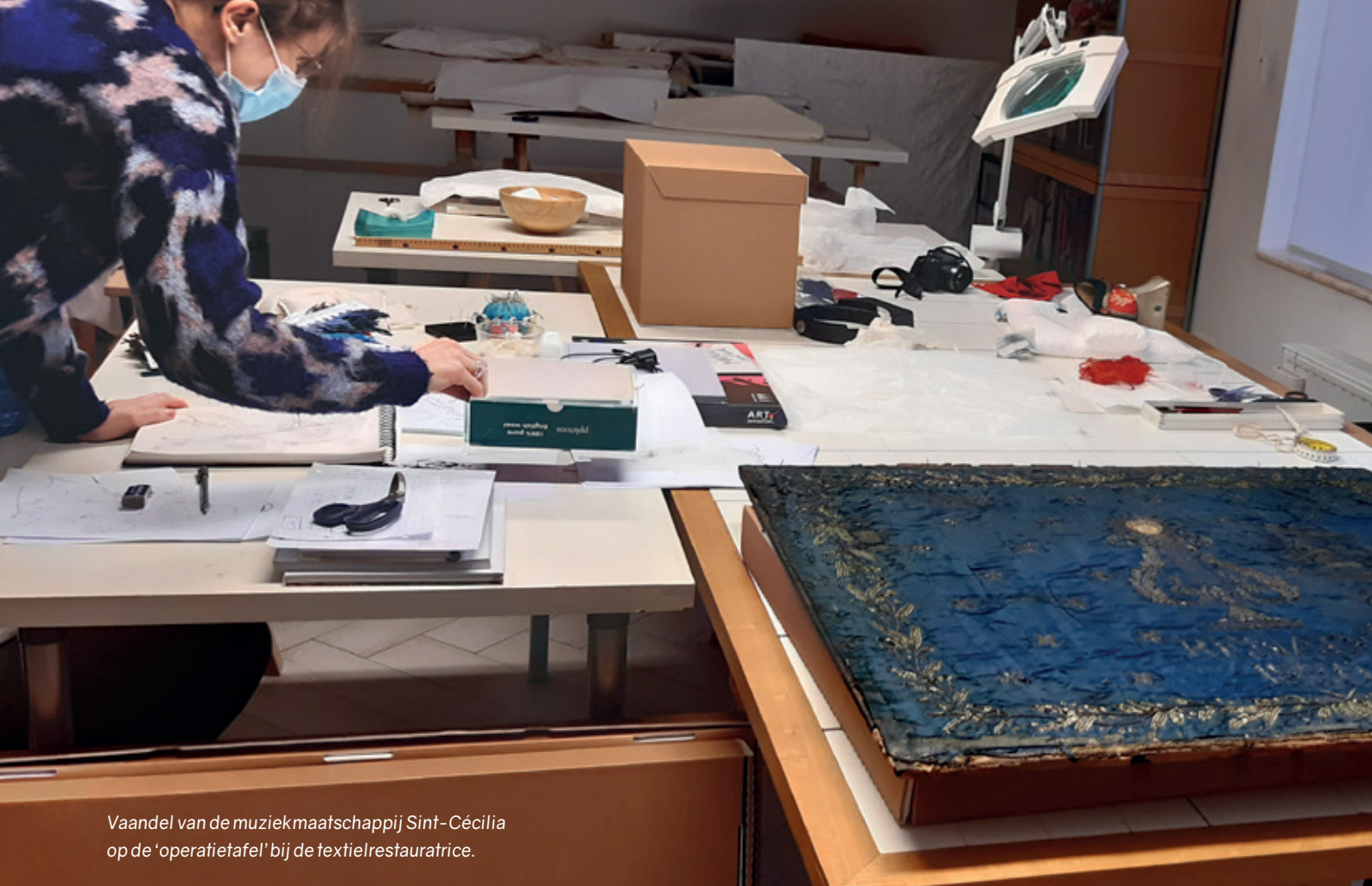
Vaandel van de muziekmaatschappij Sint-Cécilia op de 'operatietafel' bij de textielrestauratrice.