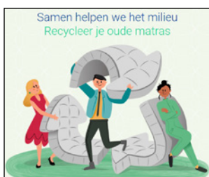
P 20 WIJZIGINGEN RECYCLAGEPARK