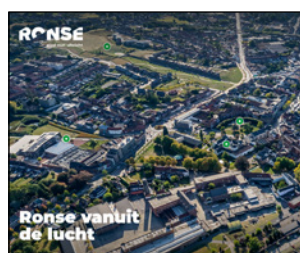
P 22 VIRTUEEL RONSE