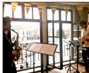
P 12 BINNENSTE BUITEN